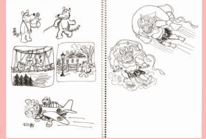
1.『11びきのねことあほうどり』リトグラフ(色校用) 1972年 こぐま社蔵(※) 2.『きつね森の山男』特装版 1999年 こぐま社蔵 3.『ぶどう畑のアオさん』原画 2001年 こぐま社蔵(※) 4.『ブウタン』「幼年ブック」1955年3月号原画 個人蔵 5.『もしも おばけやしきがあったら』「ロンパールームのほん」1967年版第4号原画 個人蔵 6. 馬場のぼる 最期のスケッチブック 2001年 個人蔵 (※)は全点展示予定